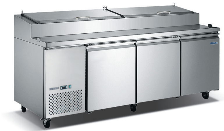
Table d'apprêtage de pizzas à trois portillons en acier inoxydable CPT242-92